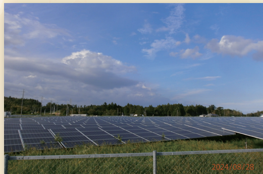
広大な田んぼが太陽光発電地帯になってしまった