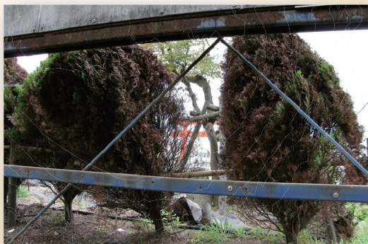
枯れてるけど...復活するかな