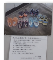
写真と声の展示イメージ

東日本大震災発生後の2011年6月より、被災した女性たちと小グループで写真を通して語り合う活動を実施。被災3県(岩手県宮古市・宮城県仙台市・石巻市・女川町、福島県郡山市・福島市)と東京の7か所のグループで継続中。展示会や写真と「声」集の刊行、報告会やワークショップなど幅広く社会に発信している。